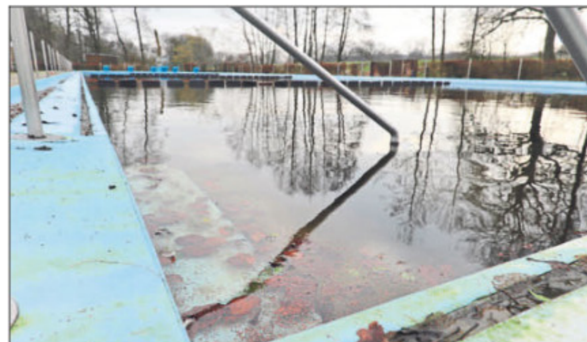
Auch im Winter bleibt Wasser im Becken und bildet so einen Gegendruck zum Grundwasser.